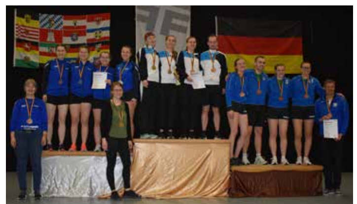
Deutscher Vizemeister im Teammehrkampf