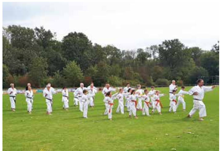
125 Jahre FSV, Karategruppe im Sportpark

Am 02. Und 03.10. war die Abteilung Karate an den Jubiläumsfeierlichkeiten anlässlich des 125jährigen Jubiläums des FSV beteiligt.