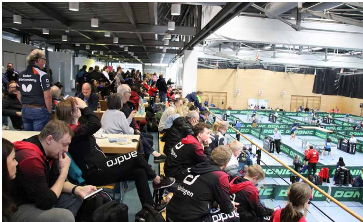
Deutsche Jugendmeisterschaft 15