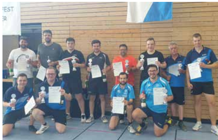
Sieger Bockbierfestturnier 2023