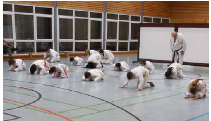
Angruß der Karatekinder

Im Jahr 2022 wurden 28 Erwachsene und 22 Kinder gemeldet.